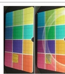
耐摩耗性試験結果