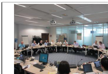
パリ国際会議風景